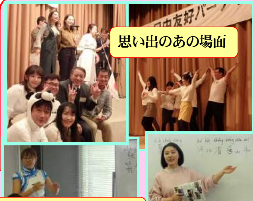
思い出のあの場面