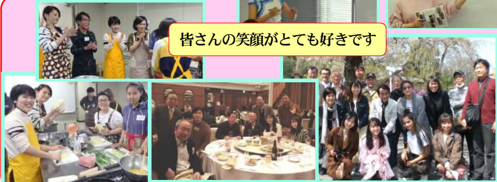
皆さんの笑顔がとても好きです

たくさんできました。受講生同士、講師と受講生、元講師と受講生との交流などを見て、援護会は人と人との繋がりをとても大事にしているところだと思いました。私はもうすぐ援護会を卒業します。残りわずかの時間ですが、まだまだ思い出を作っていきたいと思っています。 1年間、お世話になりました！これからの援護会も今までのような温もりのある場所でありたいように、そして、皆さんのご健康および中国語の上達のために祈ります。